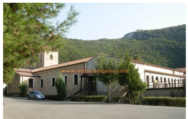
Cortile interno- parcheggio privato